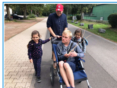
Bild: Unsere Ehrenamtlichen in der Freizeitbegleitung autistischer Menschen

Mit unseren spezifisch ausgebildeten ca. 50 Ehrenamtlichen konnten wir auch 2021 wieder eine bedarfsgerechte, individuelle Betreuung für autistische Kinder und Erwachsene anbieten. Mit großer Sorgfalt engagieren sich die Ehrenamtlichen in der Einzelbegleitung und in unseren Gruppenangeboten. Unser Angebot der Einzelbegleitung nutzen 2021 insgesamt 35 Familien/ autistische Menschen. Unsere Warteliste wächst. Deshalb suchen wir fortlaufend neue Assistent*innen.